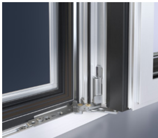
Bisagra de esquina con 180° de apertura Corner pivot with 180° opening angle