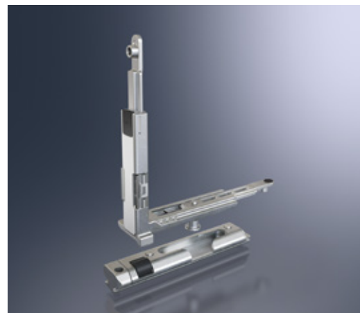
Codo de reenvío con rodillo de cierre y patín de cierre integrados Corner drive with integrated locking roller and with engagement block